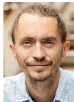
Q&A med forfatteren